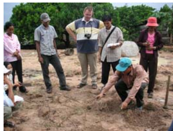
Formation au bouturage des mûriers.

Sur une autre parcelle près de 10 000 boutures de mûriers ont été plantées, si la pluie ne fait pas trop défaut, en octobre ou novembre nous pourrions récolter les premières feuilles et commencer l'élevage de vers à soie. Dans quelques temps nous pourrions produire plus de la moitié de la soie dont nous avons besoin pour notre atelier de tissage. La section agri-