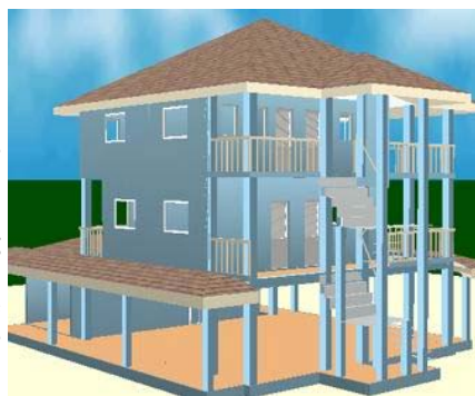
Maquette virtuelle du nouveau bâtiment.

frère, avait récolté de l'argent pendant le Carême ainsi nous aurons tout ce qu'il faut pour étudier dans de bonnes conditions. Nous en profitons pour vous saluer et vous remercier. Nous espérons qu'un jour vous pourrez venir nous visiter et nous raconter votre vie en France !