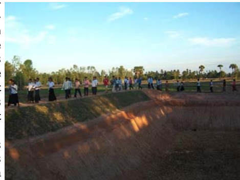
Bénédiction de la nouvelle mare creusée par l'Eglise

que nous donne nos cours d'agriculture, pour imposer ces idées nouvelles. Il n'y a pas de fatalité pour les gens de bonne volonté !